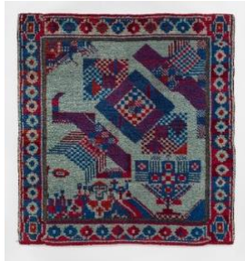
Johannes Itten, Teppich [Tapis] 1920 environ Laine, point noué, technique Smyrna 133 x 142 cm Universität des arts de Zurich / Museum für Gestaltung Zürich / Collection d'arts décoratifs