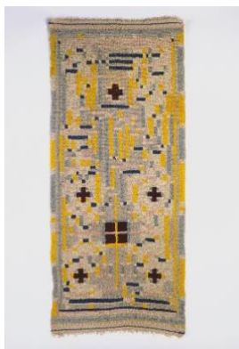
Johannes Itten, Bildteppich [Tapisserie] 1924 Laine, filée par Lucia Stehen 235 x 100 x 1,5 cm Musée régional badois, Karlsruhe