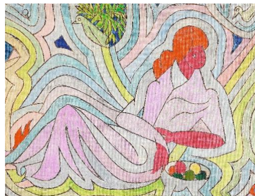
Johannes Itten, Femme aux oiseaux 1943 Huile sur toile 50 x 65 cm Collection privée